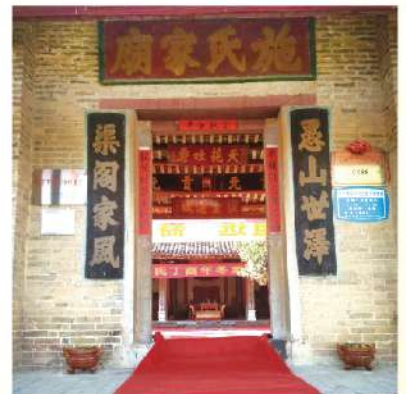
廣西賓陽施氏家廟大門