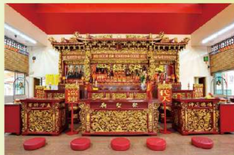
莊嚴華麗的聚聖廟內堂