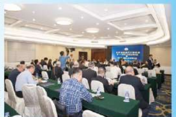
通訊員施自補 2018年10月31日

大會批准了財務報告，總會決定撥出10萬元新台幣支持平潭施天章文化研究，會議決定2019年3月15-16日在台灣彰化縣召開第十七屆第四次理監事會議，大會決定對福鼎施氏宗祠被佔部分土地，尤溪施氏宗祠拆遷等事宜盡快與當地政府溝通聯繫，協助解決具體問題。本次理監事會議暨第十七屆第二次會員大會開得生動活潑，取得明顯效果，達到預期目的，完滿完成會議各項任務。全體與會宗親還參加海峽兩岸(廈門)將軍祠文化論壇圖片展覽。