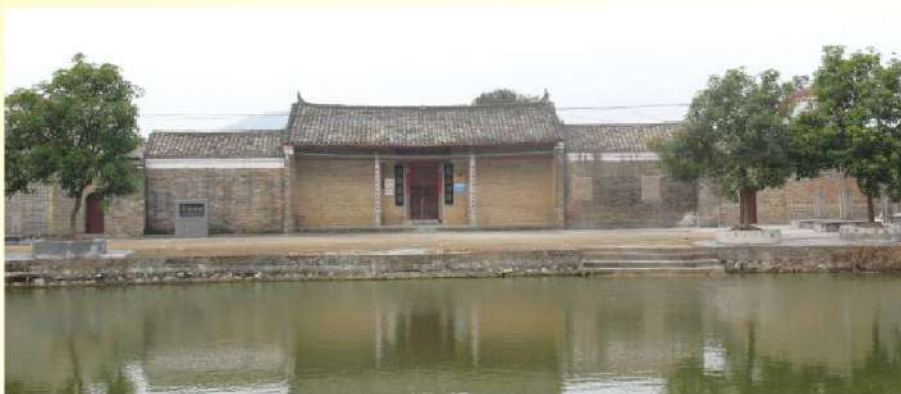
廣西賓陽施氏家廟外景

總攬全廟，整座建築歷史悠久，古色古香。廟裡廳多，屋多，楹多，柱多，匾多，碑多，對多，詩多，詞多，字(書法)多，畫多。而且對合古韻，詩含古義，詞備古義，字有古風，畫著古色，有著極深的文化底蘊和極高的藝術價值，為賓陽縣第五批文物保護單位。(圖文由廣西施氏宗親會提供)