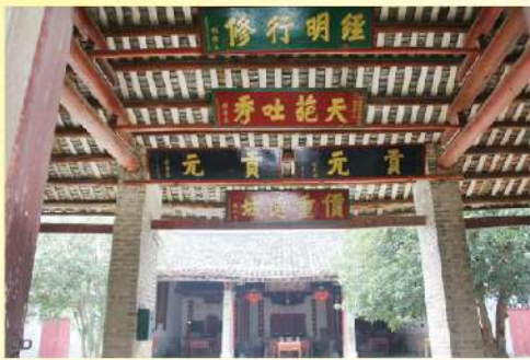
廣西賓陽施氏家廟內景

廣西賓陽施氏家廟位於賓陽施村西北面，坐西向東，始建於明朝崇禎十三年(1640年)，距今已經三百七十八年。家廟占地三千五百多平方米，有廳三座，大大小小的房屋二十二間，楹柱四十根。整座建築以前、中、後三廳為主，南北兩廊為輔。